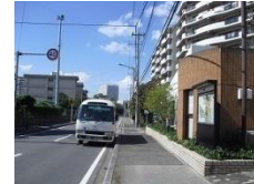
⑭ 袖ヶ浦1丁目カーブ手前