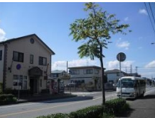
② 秋津小学校歩道橋下