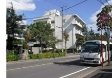
⑯ 袖ヶ浦公民館信号手前