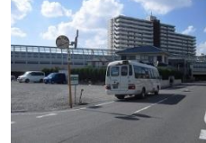
⑮ 袖ヶ浦西小学校向い